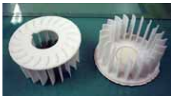
材質：ポリカーボネート 直径：100mm 造形時間：4h