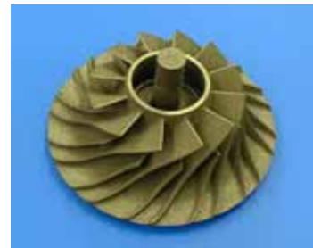
材質：鉄・ニッケル 直径：107mm 造形時間：16h